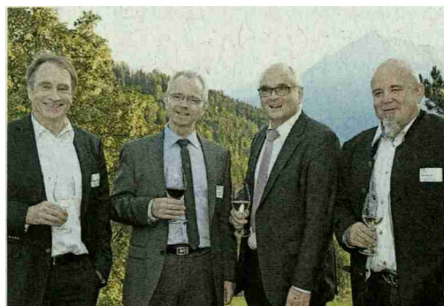
Rolf Wiggerhauser, Thuner Amtsanzeiger / Jürg Wägli, Berner Reha Zentrum, RR Pierre Alain Schnegg / Michael Seiler, Thuner Amtsanzeiger